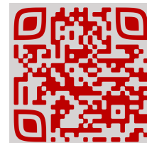
Moon Camp Challenge